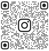
Compte instagram du @pigeonreporter

Pour commencer, Le Pigeon Reporter a désormais son compte Instagram, allez nous suivre pour être au courant de chaque sortie ! Un site internet sera également bientôt créé. Vous y trouverez tous nos numéros