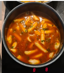
Tteokboki (étape 1)