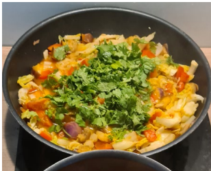
Les légumes après cuisson