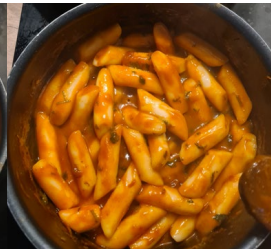
Tteokboki après avoir réduit (étape 2)