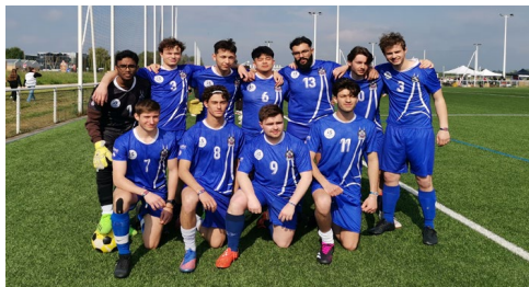
Notre chère équipe de football

L'équipe de Football se trouvait face à un gros défi en étant dans la même poule que l'équipe 1 de Centrale Supélec. Pour se donner une chance il fallait trouver un nouveau cri de guerre : malheureusement le fameux « 1, 2, 3, 4, 5 » n'aura eu raison de leurs efforts et l'équipe sera éliminée malgré une victoire et un match nul. Toutefois, les footeux étaient très heureux de pouvoir participer à la soirée sans avoir à jouer le dimanche.