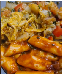
Dans l'assiette !!!