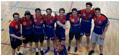
Nos volleyeurs préférés